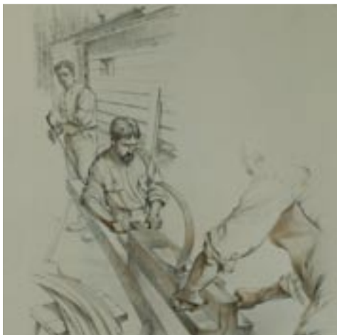
"Chiamati dall'I.R. Presidenza dell'Arsenale a fabbricar doghe di faggio, introdussero l'arte della fabbricazione dei tamisi e delle scatole"