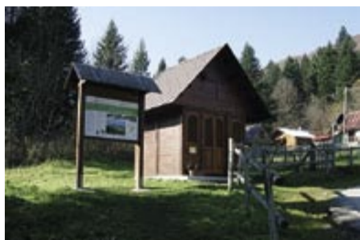
Chiesetta della Madonna Assunta di recente ristrutturata a Vallorch

La scenografia con le bandiere appese attorno alla Chiesetta e i cason in festa era perfetta e anche gli abitanti del villaggio sembravano aver dimenticato per un giorno le piccole e grandi incomprensioni che sempre accompagnano il vivere quotidiano di una comunità.