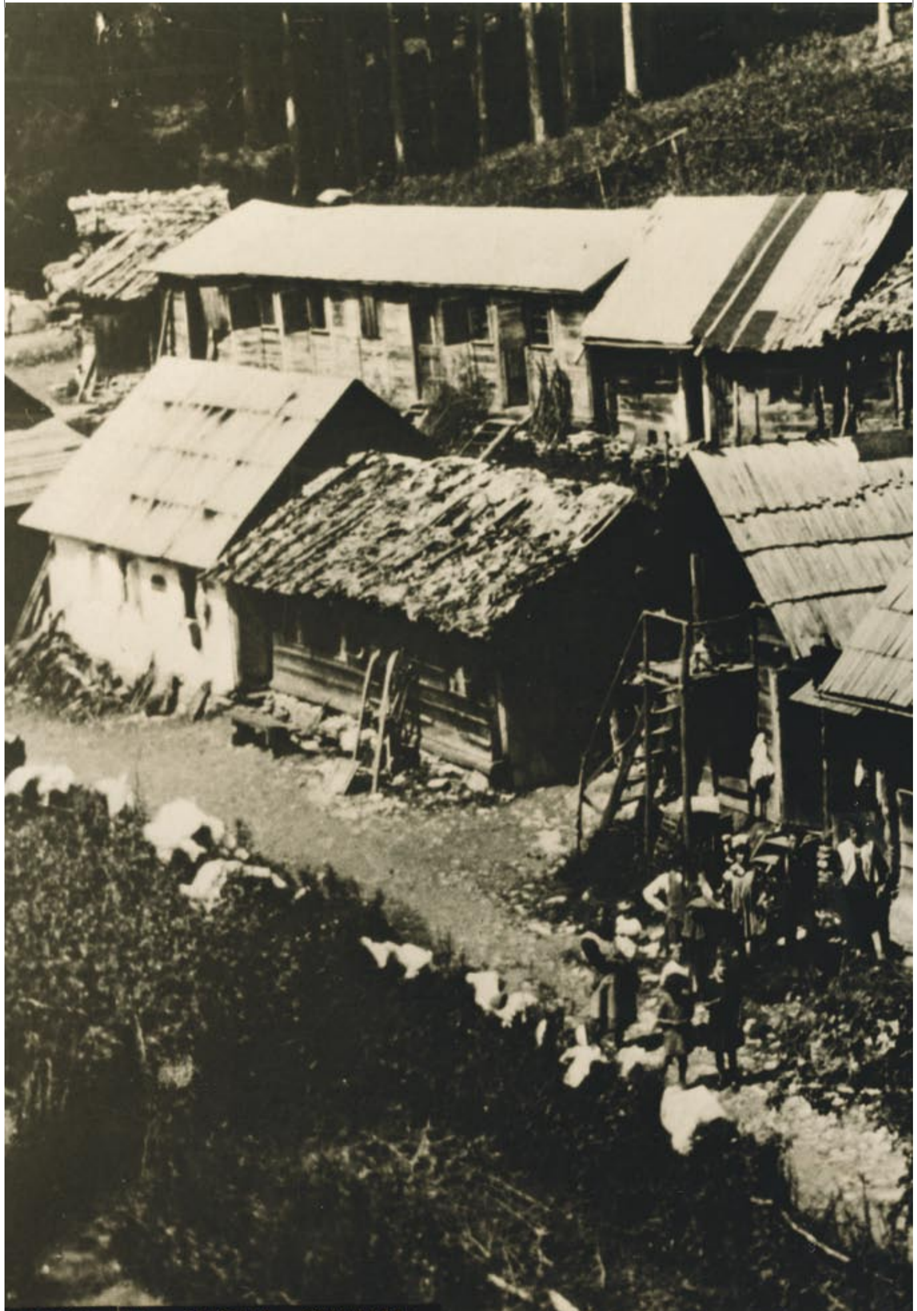
1938 - LA VECCHIA COMUNITA