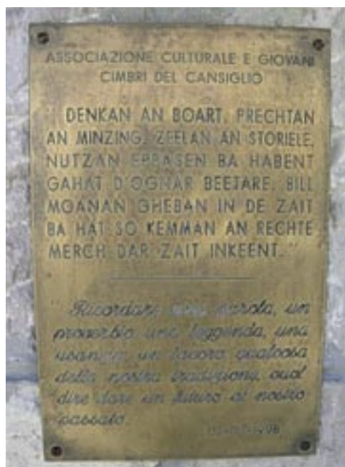
Targa apposta sulla fontana di Pian Osteria.

Documenti storici importanti ci danno conferma di tali inizi :