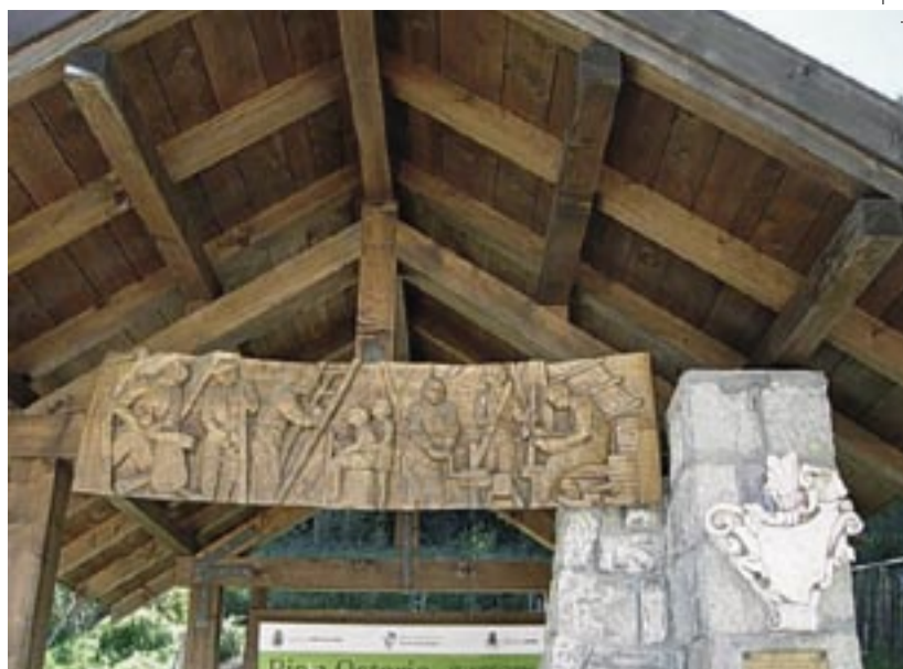
Fontana restaurata dall'Associazione Cimbri