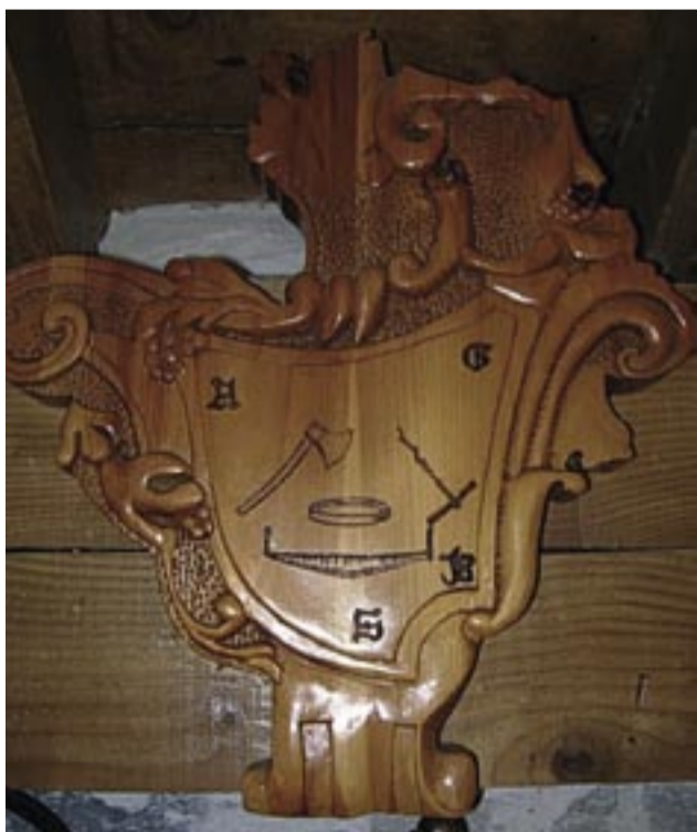
Stemma dell'Associazione Culturale Cimbri del Cansiglio con le iniziali dei cognomi delle famiglie Azzalini, Gandin, Bonato e Slaviero

I Cimbri sono una minoranza etnico linguistica di origine germanofona riconosciuta dallo Stato italiano, dalla Regione Veneto e dalla Provincia di Belluno